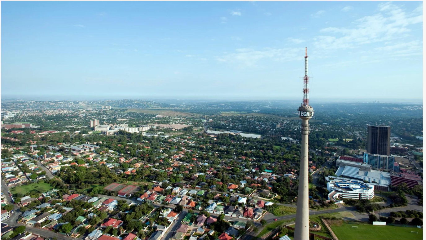
Tag 1 | 09.08.2024 | Flug nach Johannesburg